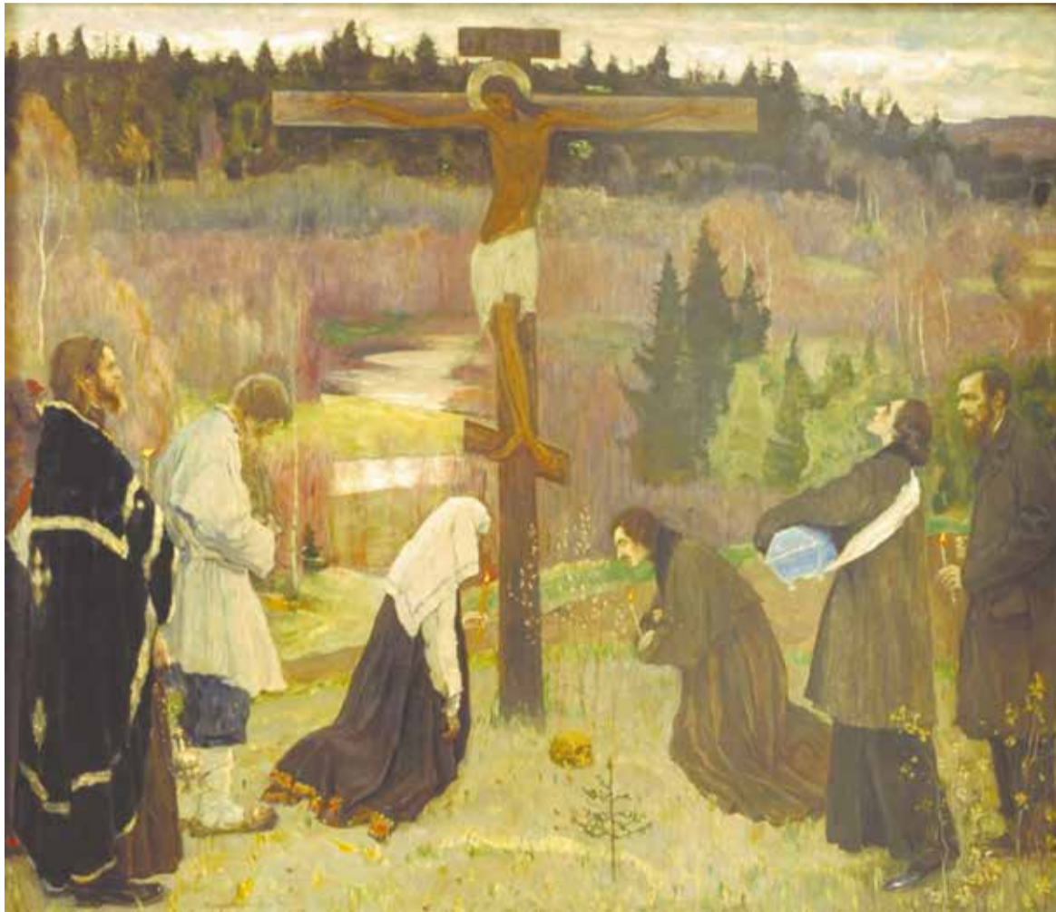
«Страстная седмица». ХУДОЖНИК МИХАИЛ НЕСТЕРОВ

Здесь, на земле, есть верующие и неверующие, а за финишной лентой земного пути – все верующие. Там человеческие души видят то, во что мы, православные христиане, веруем; видят и то, во что сами верить не хотели. И для всех них наша молитва к Богу будет драгоценным даром.