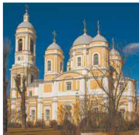
Князь-Владимирский кафедральный собор г. Санкт-Петербурга

(Справа – фото прмч. Серафима Клинского из судебного архива.)