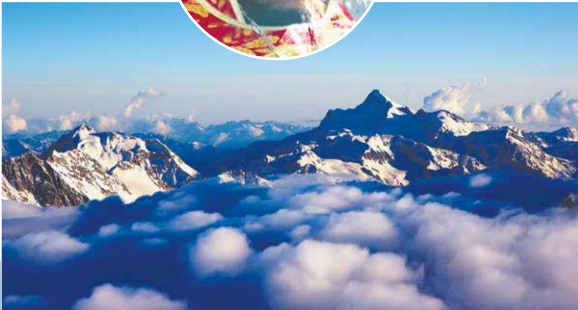
Вершина горы Эльбрус.

Первое время на Эльбрусе у нас ушло на акклиматизацию. Стали лагерем на