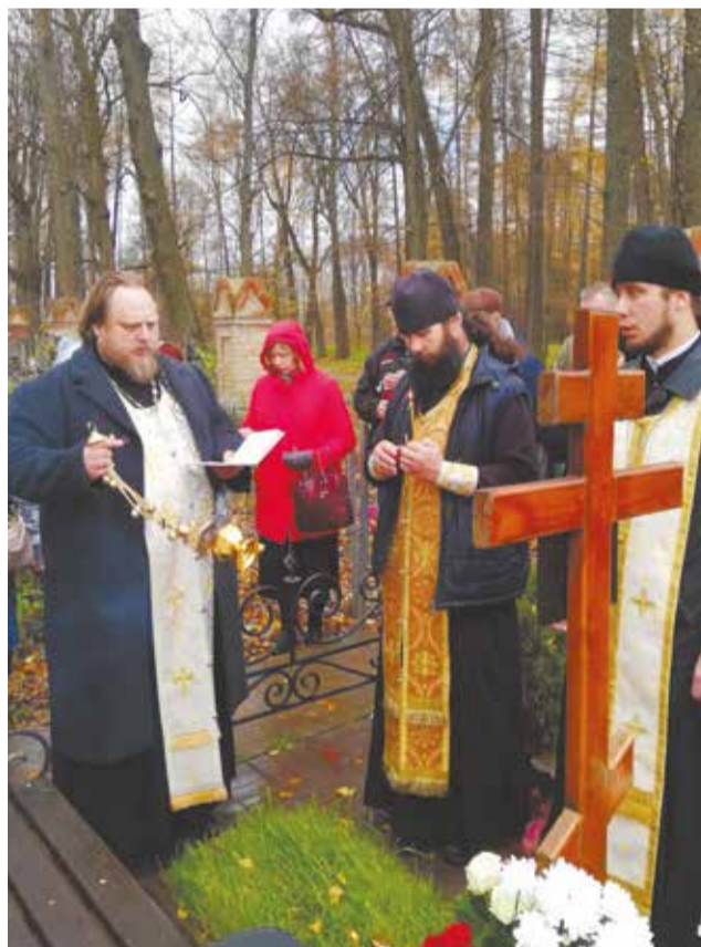
Панихида на могиле.

Суббота мясопустная посвящена предпамятению Страшного суда Христова, она важна для душ умерших христиан: общение живых с ними через молитву является выражением общего единства Церкви Христовой.