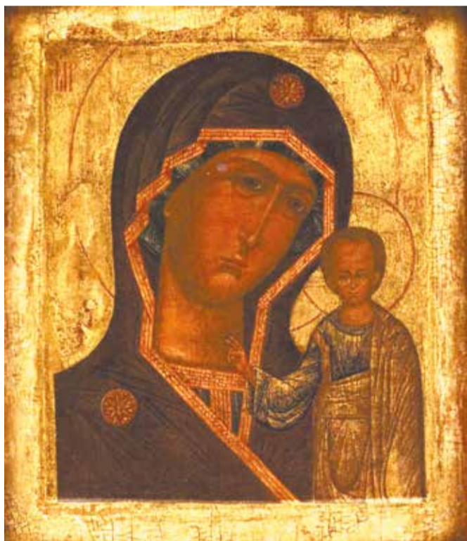
ИКОНА ПРЕСВЯТОЙ БОГОРОДИЦЫ «КАЗАНСКАЯ»

В русской православной традиции Пресвятая Богородица всегда особо почиталась верующими. В XII веке князь Андрей Боголюбский ввел в русский церковный календарь новый праздник – Покров Пресвятой Богородицы, обозначив идею покровительства Божией Матери православным христианам. Отсюда и такое большое количество икон Богородицы. Духовный образ Матери Иисуса Христа стал очень близок верующим людям, потому так и любимы самые разные Её иконы. Через них Богородица многократно подавала Свою помощь бедствующим. Многие богородичные иконы называли по месту, где их особо почитали: Владимирская, Тихвинская, Иверская. Некоторые иконы называли эпитетами из церковных и библейских текстов, например из хвалебных песнопений – акафистов: «Неопалимая Купина», «Всех скорбящих Радость» и другие. В этом номере мы поговорим об иконографии и истории двух почитаемых богородичных икон: «Казанская» и «Всех скорбящих Радость». // Геннадий АЛЕКСЕЕВ, иконописец