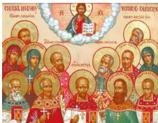
Фрагмент иконы «Собор Клинских новомучеников»