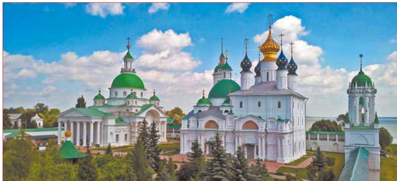
Спасо-Яковлевский мужской монастырь в г. Ростове Великом, где находится рака с мощами свт. Димитрия Ростовского.

Успенский кафедральный собор в Ростове Великом – первый христианский храм на северо-востоке Руси, древнейшая и величайшая святыня Ярославской земли. Собор был построен в 1508–1512 годах и стал уже пятым храмом на этом месте, а первые богослужения начались здесь в 991 году. По словам святителя Филарета, порог собора многократно стирался ногами святых. В 1314 году здесь был кре-