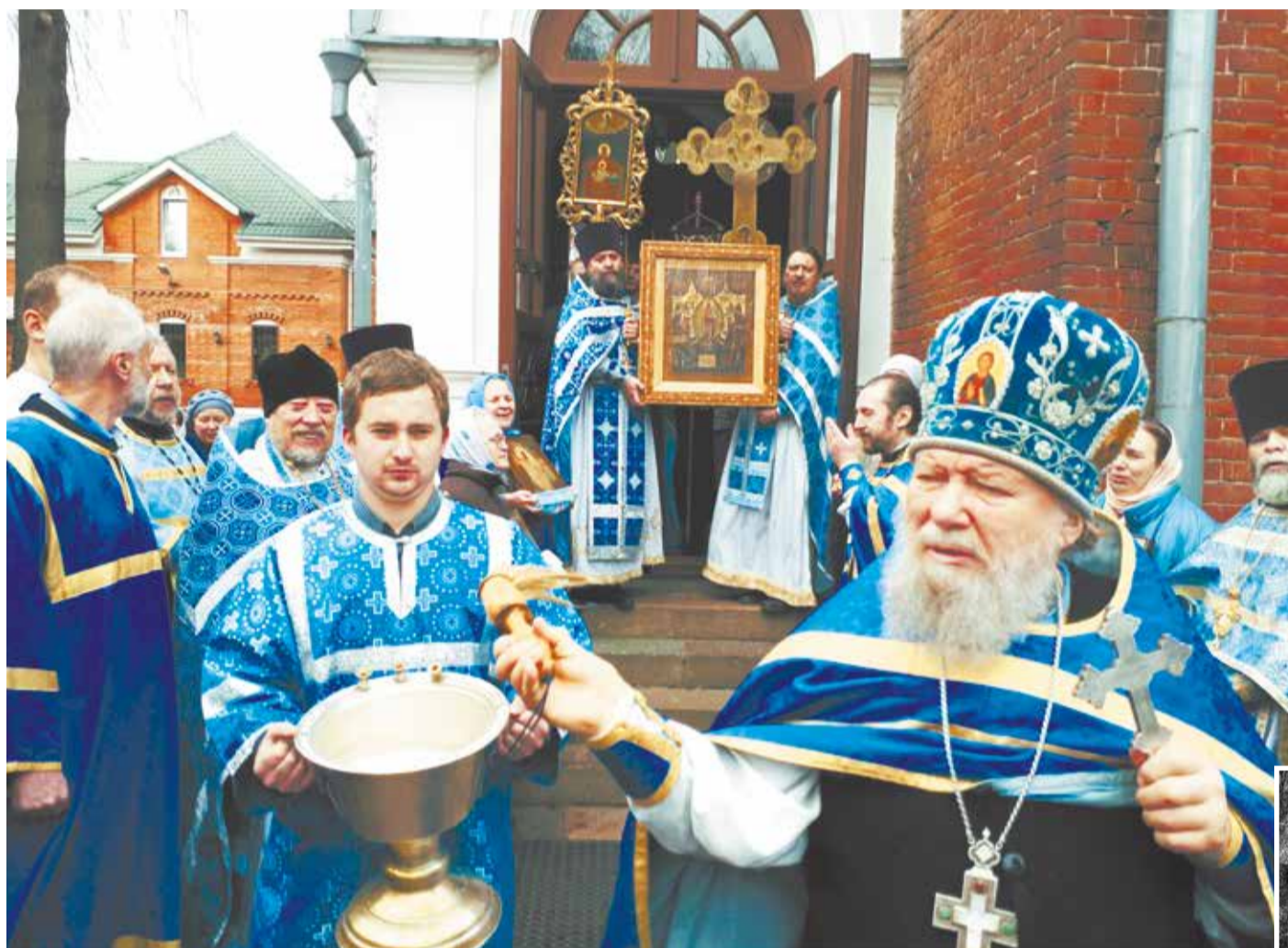
Престольный праздник в Скорбященском храме г. Клина.