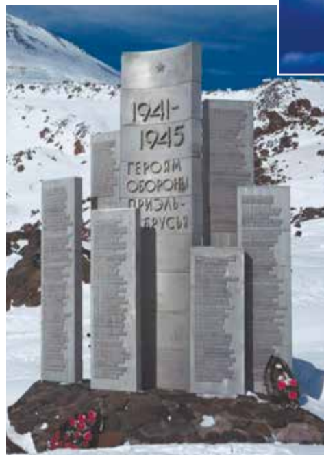
Памятник «Героям обороны Приэльбрусья».

В горах чем выше – тем сильнее ультрафиолетовое излучение. Попадая в глаза, оно их сильно повреждает, и можно даже ослепнуть. Поэтому нужны или очень дорогостоящие очки (не просто тёмная пластмасса, она ультрафиолет не задерживает), или купленные за совсем небольшие деньги в строительном магазине простые очки сварщика: они из обычного оконного стекла, к тому же тёмные и наглухо закрыты по бокам. Там, где тебе при-