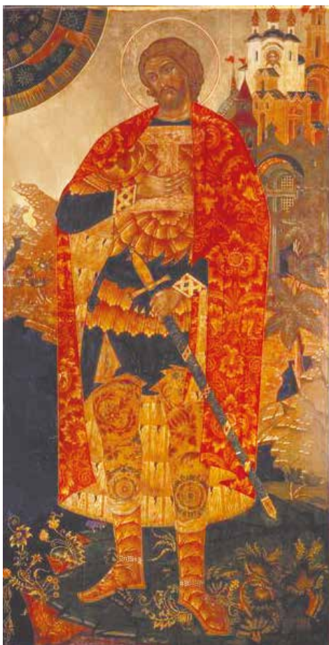
Икона св. блгв. кн. Александра Невского, написанная прмч. Серафимом Клинским

Святые Клинской земли / О наследии преподобномученика Серафима (Вавилова)